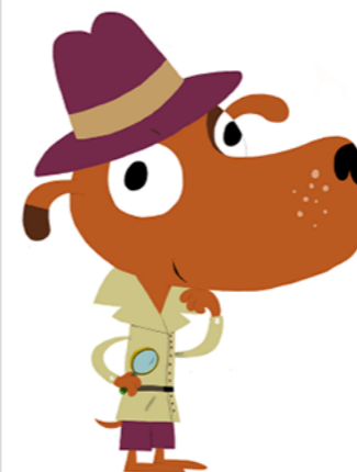
Illustration : © Hélène Convert, d'après un personnage créé par Nathalie Choux / Milan Presse 2020.

GEO ADO , tous les mois une fenêtre ouverte sur notre monde complexe et passionnant.